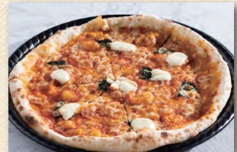
今週のおまかせピッツァ