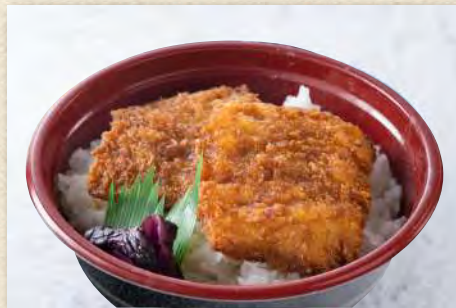
新潟ブランド「越乃黄金豚」の たれかつ丼