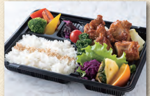
「越の鶏」の新潟から揚げ弁当