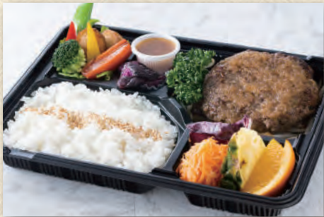
新潟ブランド「あがの姫牛」と 「純白のビアンカ」ハンバーグ弁当