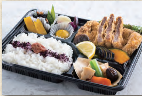
新潟ブランド「越乃黄金豚」