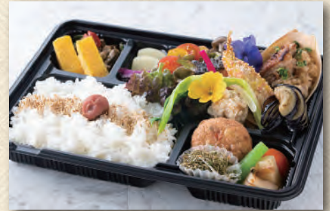
特製ミックスフライ弁当